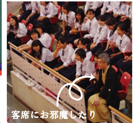
客席にお邪魔したり