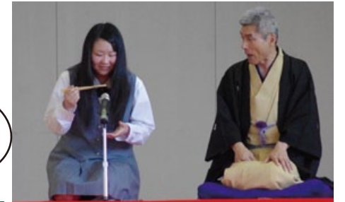
蕎麦のすすり方を伝授したり